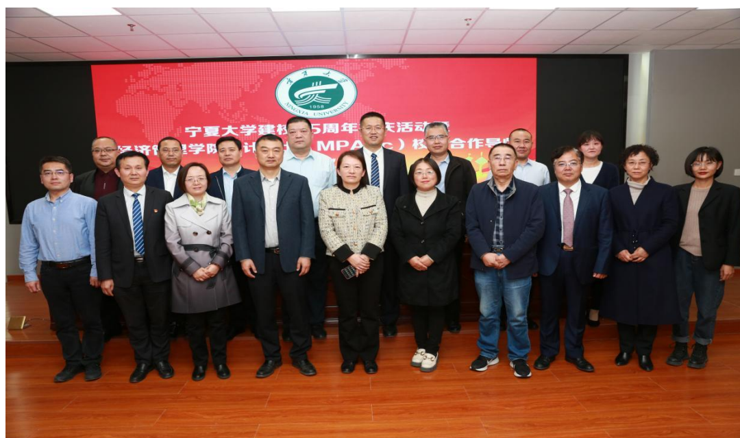
图 2 2023 年 MPAcc 行业导师聘任仪式