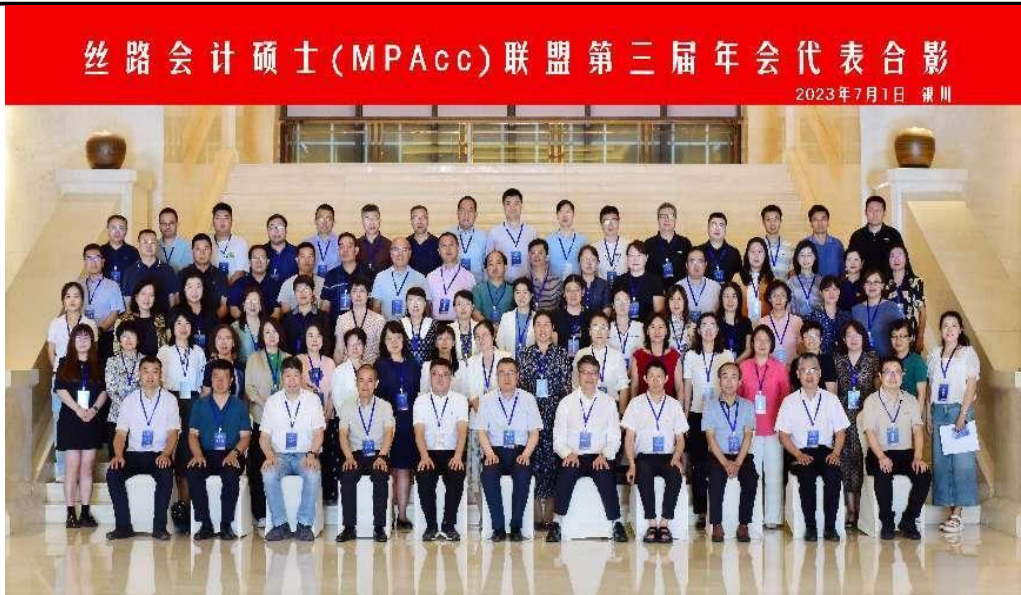
图3 丝路会计硕士 (MPAcc) 联盟第三届年会

为了进一步加强理论教学与实践教学相结合，深化联盟院校之间的竞争、合作与交流，聚焦研究生综合能力培养，2023年7月1日-2日，丝路会计硕士 (MPAcc) 联盟第二届学生案例大赛在宁夏大学举行，共有 18 支队伍进入决赛，本次大赛成功举办推动了 MPAcc 学员亲历企业实践、模拟管理决策、比拼解决方案，培养学生发现、分析、