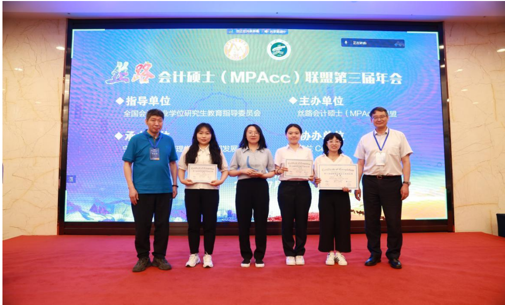
图 4 丝路会计硕士（MPAcc）联盟第二届学生案例大赛

解决企业实际问题的能力，同时促进联盟单位间 MPAcc 学员的交流与沟通，为学员实践能力的提升打下良好的基础。宁夏大学 MPAcc “一时起意队”获得大赛二等奖，并获得“优秀团队故事小视频”奖项，“优秀指导教师”称号。